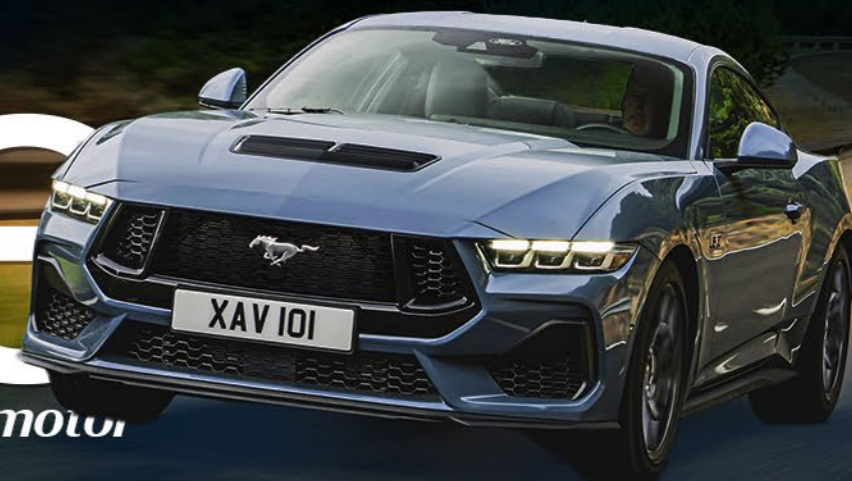
Ford Mustang 60 Aniversario

la revista digital e interactiva del motor