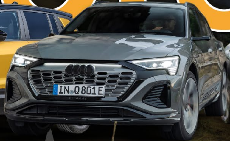
Audi Q8 e-Tron