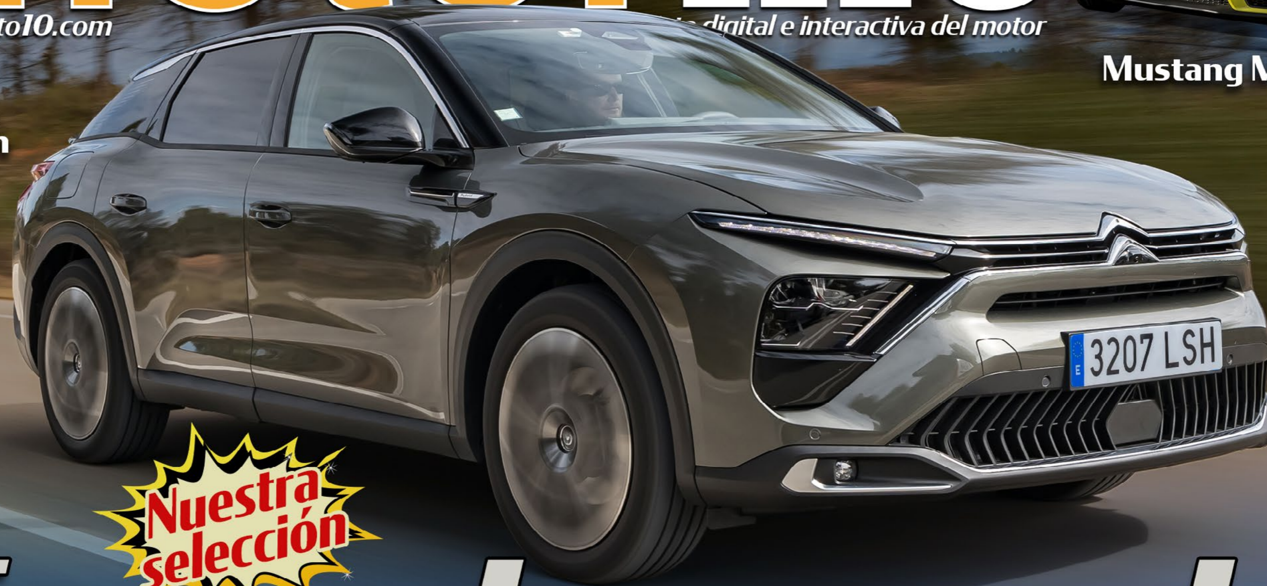
Citroën C5 X