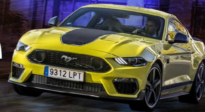
Mustang Mach 1