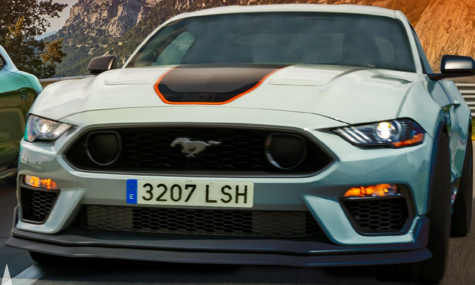
Ford Mustang Mach 1 ▲