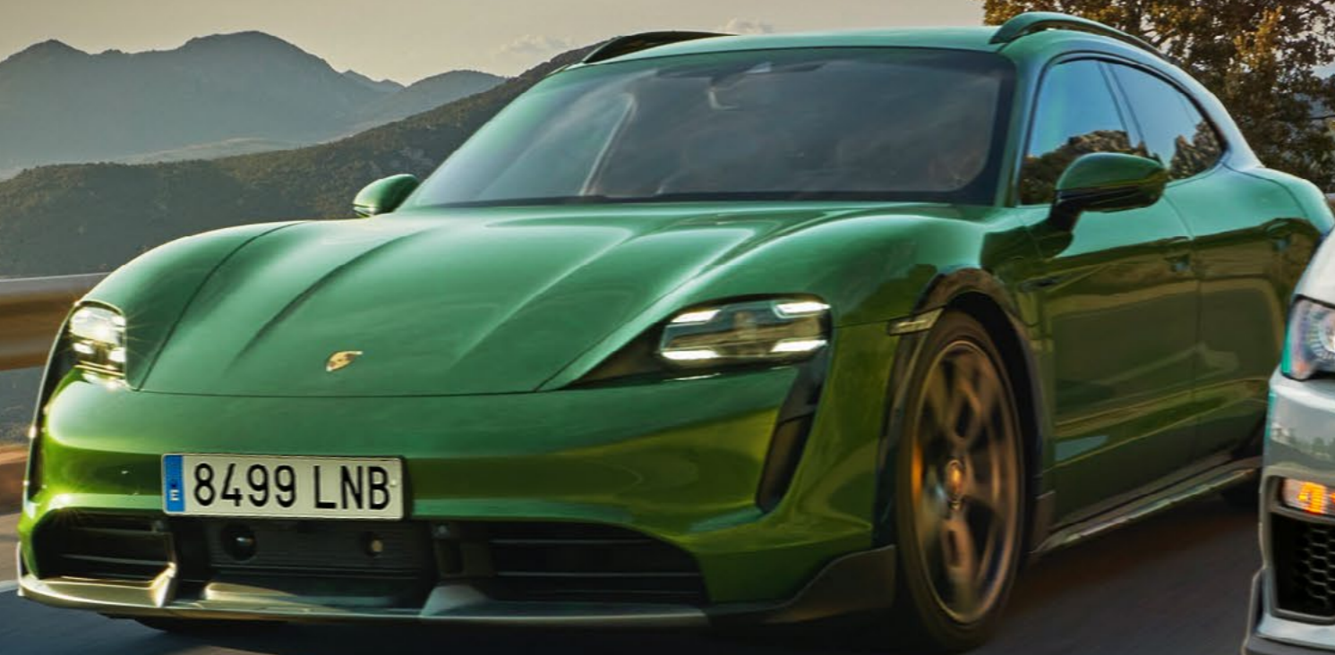
▲ Porsche Taycan Cross Turismo